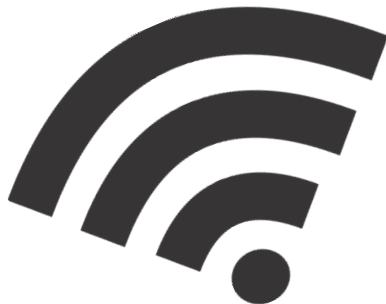
Linkes Bild